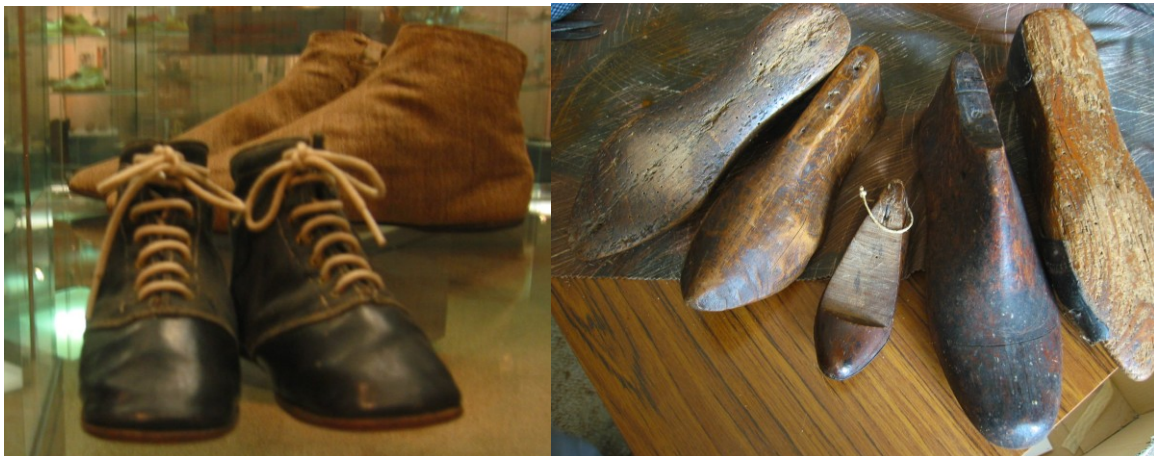
Foto 2a en 2b, kinderschoentjes 1840-1860 rechte leesten ook voor kinderschoentjes

Er waren op die dagen veel H.Missen, tussen de vroegmis en de hoogmis waren meestal nog 3 H.Missen dat kwam voor grote gezinnen goed uit om de schoenen van eigenaar te kunnen verwisselen voor de verplichte kerkgang. Het klompen geklikklak in de kerk was niet gewenst. De familie van Gogh hield grote afstand van dat dorpsgedoe en hebben voor zover bekend nooit klompen gedragen. Na de babyslofjes kwamen de kleuterschoentjes, dat model (1840-1860) is in het leer en schoenenmuseum te Waalwijk te zien.